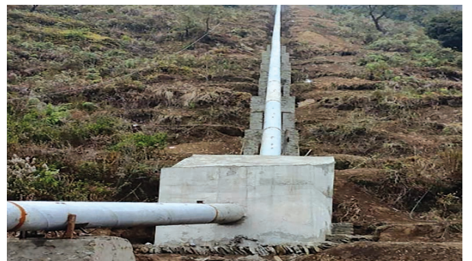
पेनस्टक पाईप (पेनस्टक पाईप अलाईमेन्ट)