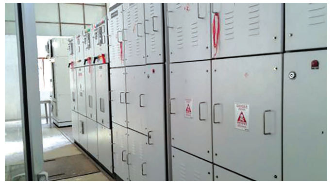
नियन्त्रण प्रणालि (कन्ट्रोल प्यानल)