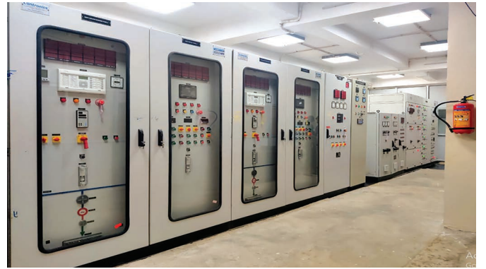
नियन्त्रण प्रणालि (कन्ट्रोल प्यानल)