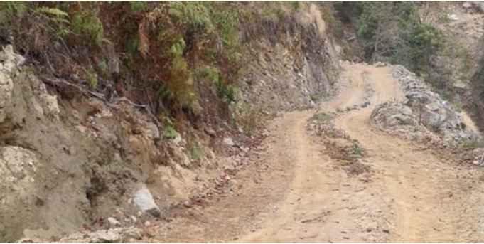
निर्माणधिन माथिल्लो छन्दीखोला साना जलबिद्युत आयोजनाको नरम चट्टान भएको पहुँचमाग