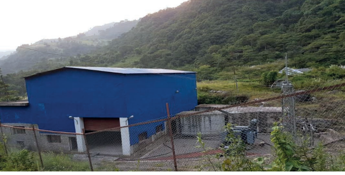
छन्दीखोला साना जलबिद्युत आयोजनाको पावरहाउस