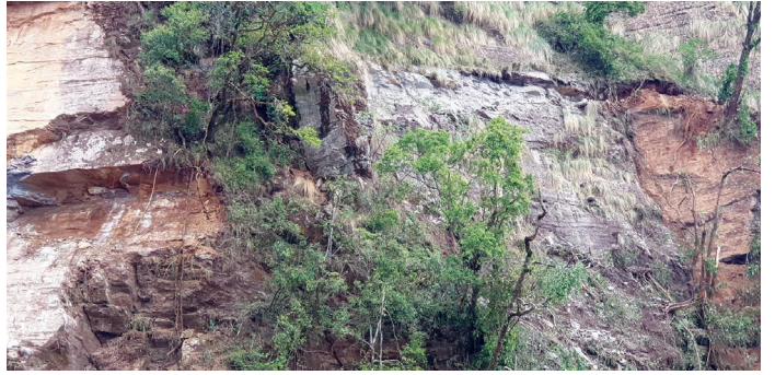
निर्माणधिन माथिल्लो छन्दीखोला साना जलबिद्युत आयोजनाको कडा चट्टान भएको पहुँचमाग