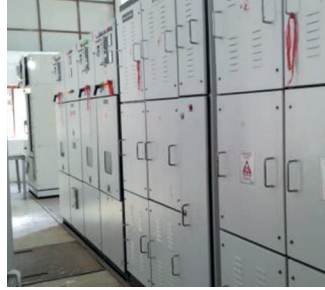
छन्दीखोला साना जलबिद्युत आयोजनाको बिद्युत नियन्त्रण प्रणालि (कन्ट्रोल प्यानल)