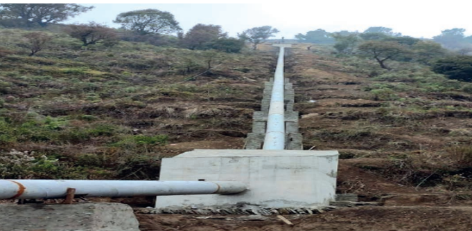
निर्माणधिन माथिल्लो छन्दीखोला साना जलबिद्युत आयोजनाको पेनस्टक पाईप (पेनस्टक पाईप अलाईमेन्ट) संरचना