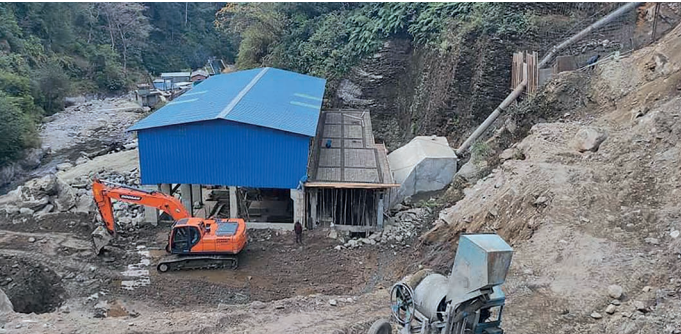
निर्माणधिन माथिल्लो छन्दीखोला साना जलबिद्युत आयोजनाको निर्माणधिन बिद्युतगृह (पावरहावस)