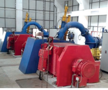
छन्दीखोला साना जलबिद्युत आयोजनाको जेनेरेटरहरू (ट्रवाइन)