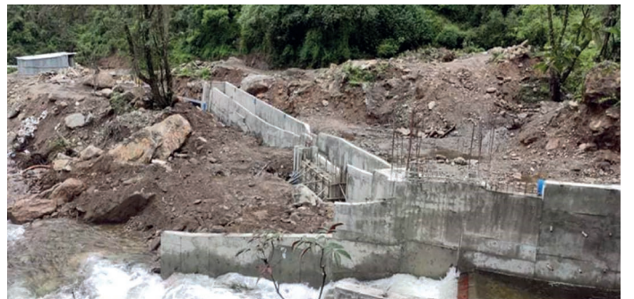
निर्माणधिन माथिल्लो छन्दीखोला साना जलबिद्युत आयोजनाको मुहान (ईन्टेक) संरचना निर्माणस्थल ।