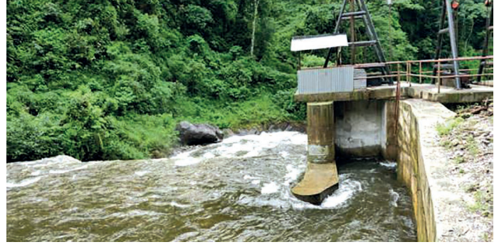
छन्दीखोला साना जलबिद्युत आयोजनाको मुहान (ईन्टेक)